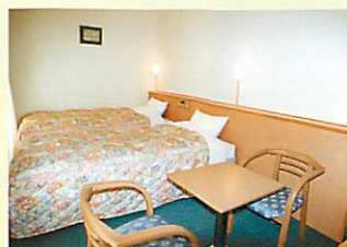
ツインデラックス