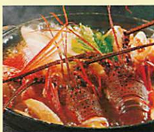
奄美産 伊勢エビ鍋