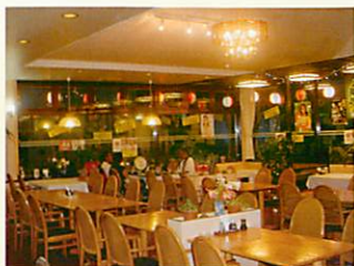
郷土料理レストラン 『あさばな』(76席)