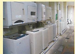
コインランドリー施設