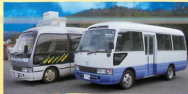
マイクロバス 2台(50名様)まで送迎可能です

名瀬新港(早朝OK)・空港バス市内発着所・繁華街・ 結婚式場等、他、遠方をご相談に応じます。