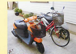
レンタルバイク・自転車