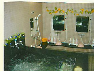
光明石温泉・サウナ(男女別)