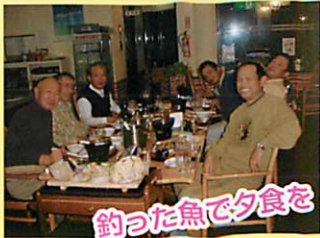
釣った魚で夕食を