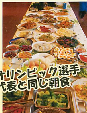
オリンピック選手 代表と同じ朝食