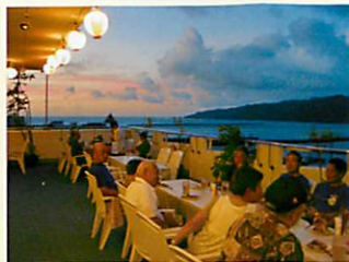
雨でもOK! 屋根付ビアガーデン(180席)