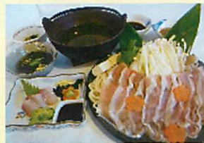
奄美産 黒豚しゃぶしゃぶ